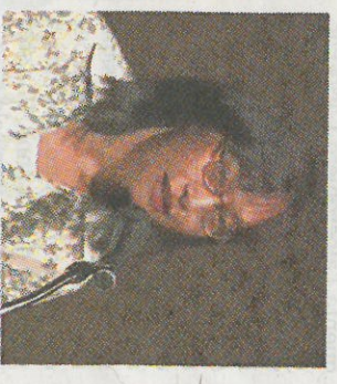
La scrittrice e ricercatrice cinese Pun Ngai

C'è rischio nel “piccolo”? Per esempio, nel commercio al dettaglio, nei bar, nei negozi che ormai gli immigrati cinesi gestiscono in larga parte?